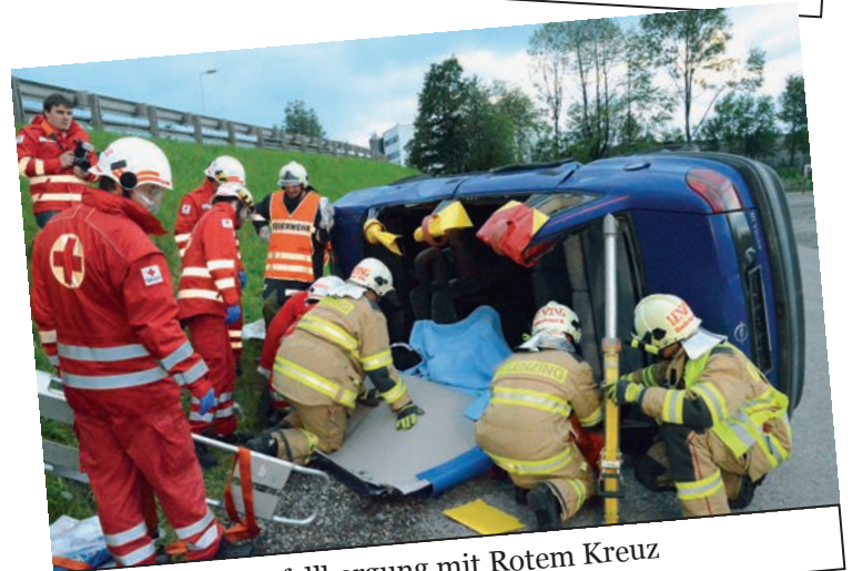
Unfallbergung mit Rotem Kreuz