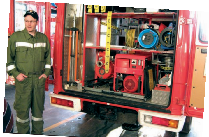
Schulung mit dem Ölfahrzeug Seewalchen