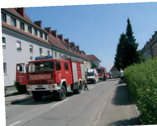
Brand in Otto Glöckl Straße