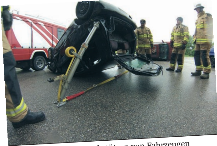
Übungsthema Abstützen von Fahrzeugen