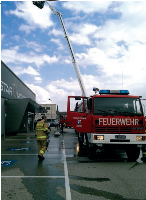
Großübung im Starmovie