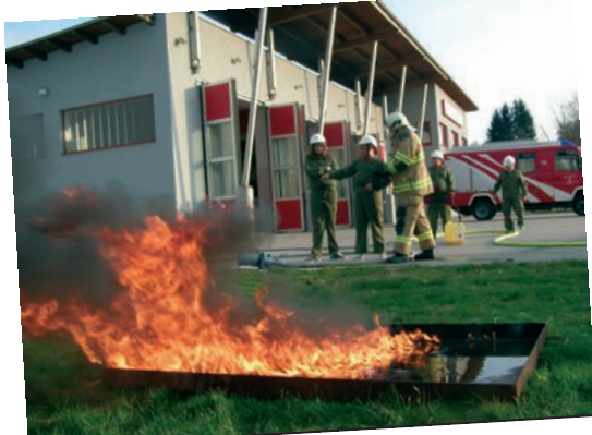
Eine heiße Übung!