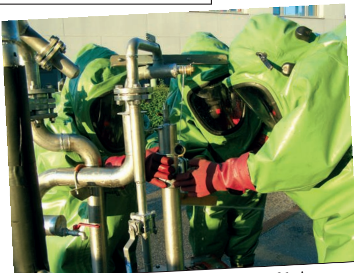
Gefährliche Stoffe Übung mit FF Puchheim