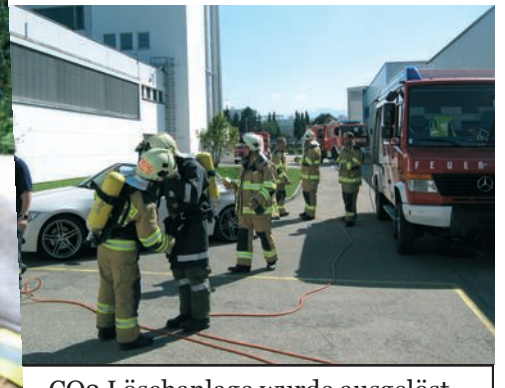
CO2 Löschanlage wurde ausgelöst