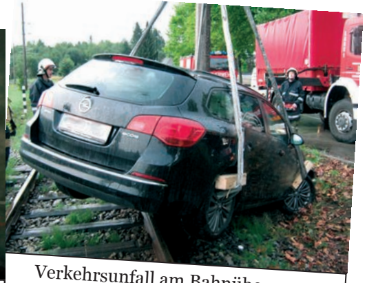
Verkehrsunfall am Bahnübergang