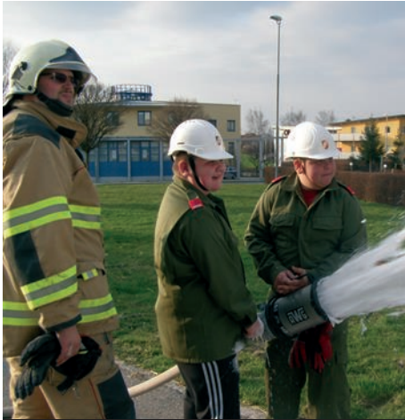
Schaumübung im Feuerwehrhaus

Seit Sommer haben sich die zukünftigen Feuerwehrmitglieder auf die Prüfung vorbereitet. Fragen über die Gemeinde und die Feuerwehr mussten gelernt werden, Ausrüstung aus den Fahrzeugen korrekt benannt