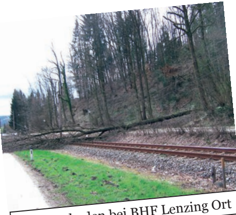
Sturmschaden bei BHF Lenzing Ort