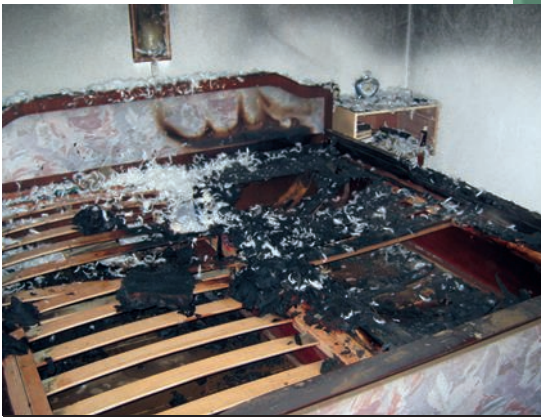
WBK Einsatz in Reibersdorf