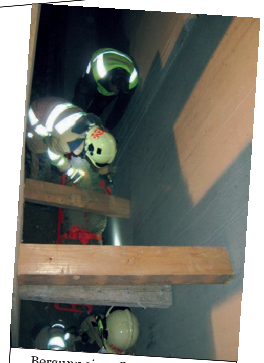
Bergung einer Puppe aus einer Baugrube